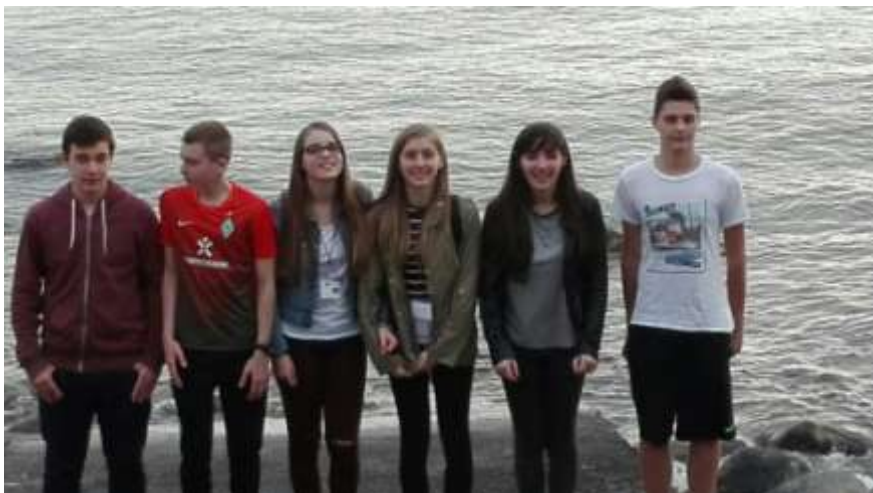
Slika z učenci iz